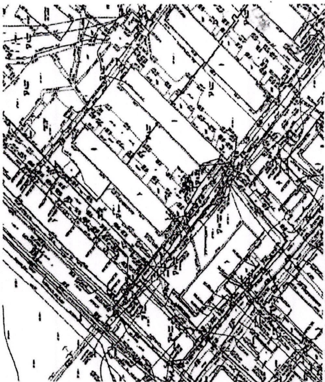
Схема границ территории, необходимой для проведения мероприятий по сносу многоквартирного Дома, включенного в Программу реорганизации жилищного фонда в городе Москве, в отношении которого применяется решение о выводе из эксплуатации

Приложение к распоряжению префектуры от «10» ИЮНЯ 2022 г. № 127-П/17